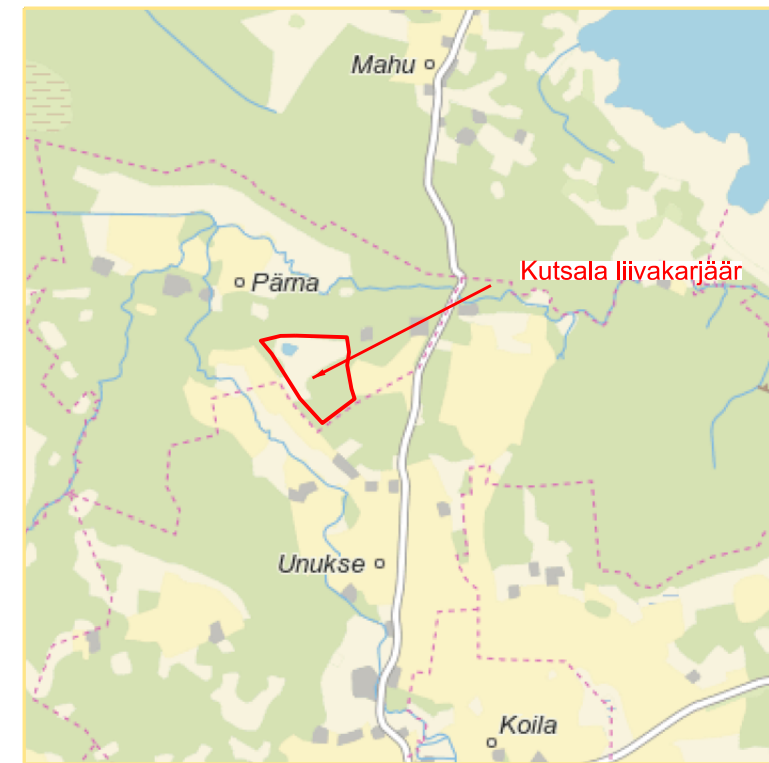
Kutsala liivakarjääri mäeeraldise piiripunktide koordinaadid ja pindala